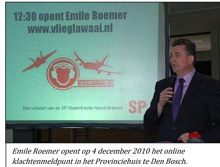
Emile Roemer opent op 4 december 2010 het online klachtenmeldpunt in het Provinciehuis te Den Bosch.